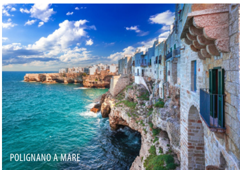
POLIGNANO A MARE