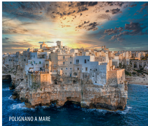
POLIGNANO A MARE