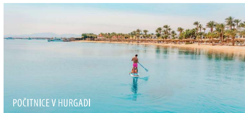
POČITNICE V HURGADI